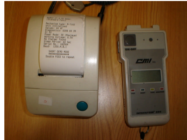
Equipo Intoxilyzer 400 PA