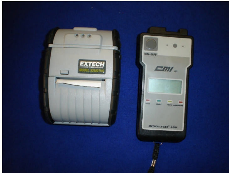
Equipo Intoxilyzer 400 Con Infrarrojo